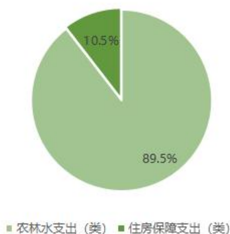
图3：2022年财审中心一般公共预算财政拨款支出结构图